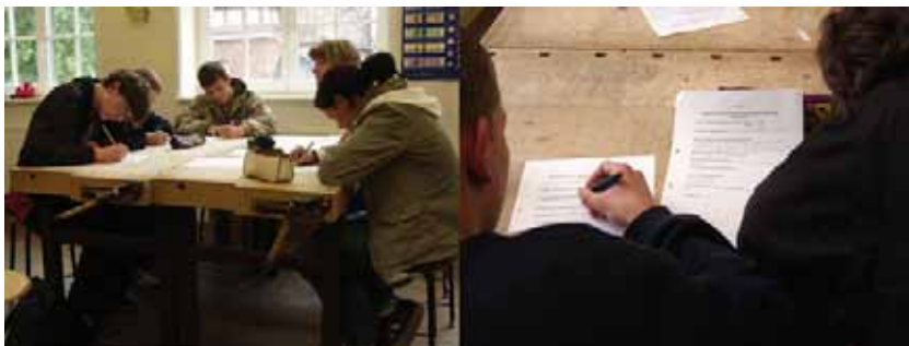
Gruppenpuzzle in Klasse 9c.

Wichtig bleibt: alle Schüler innerhalb einer Gruppe sollen die Aufgabenstellung erfassen und bearbeiten. Es ist darauf zu achten, dass nicht einige Gruppenmitglieder Inhalte nur von den Arbeitsblättern der anderen abschreiben. So bleibt der Sinn - gegenseitige Unterstützung und Voneinander-Lernen - auf der Strecke.