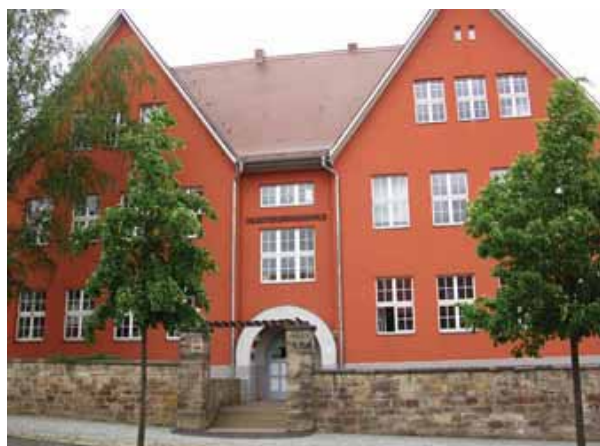
Klosterbergschule, Bad Berka.

Diese Dokumentation orientiert sich im Allgemeinen am Verlauf des Projektes im gesamten Schulbetrieb, mit einem Schwerpunkt auf der Entwicklung in der Fokusklasse 9c.