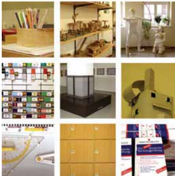
Eindrücke aus der Schule.

integriert hat. Wenn dieser Prozess konsequent weitergeführt wird, die positiven Bedingungen erhalten werden, ein Erfahrungsaustausch zwischen beteiligten Schulen initiiert wird und extern begleitet wird, dann kann es in den kommenden Jahren zu einer weiteren deutlicheren Verbesserung des Leistungsniveaus und des sozialen Klimas an dieser Schule kommen.