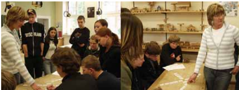
Gemeinsame Auswertung des Gruppenpuzzles.