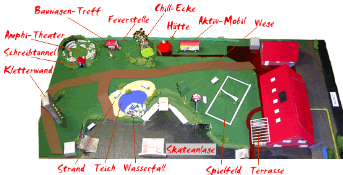
Abbildung 1: "Profi-Modell"

Unter Einbeziehung eines Landschaftsplaners und der zuständigen Fachbereiche der Kommunalverwaltung wurden die Vorschläge der Mädchen in einen umsetzungsfähigen Plan eingearbeitet. Das daraus entstandene „Profi-Modell“ wurde den beteiligten Jugendlichen vorgestellt, gemeinsam erörtert und von den Mädchen genehmigt.